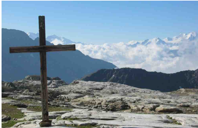
Bild 2: Bergpanorama nach dem Aufstieg zum Lötschenpass – Ganzheitliches Naturerleben oder Anlaß vielfältigen Lernens?

merkmalen ganzheitlich anzusprechen oder angesprochen zu haben? Aber entweder sind wir ganzheitlich oder wir sind es nicht. Nur ‚ein bisschen‘ Ganzheitlichkeit gibt es nicht - ebenso wenig wie man nur ‚ein bisschen‘ schwanger sein kann. Ich bin davon überzeugt, wenn wir aber mit dem Anspruch der Ganzheitlichkeit auftreten, dann dürfen wir nicht nur in der Planung unserer Settings konzeptionell den ganzen Menschen berücksichtigen wollen und hoffen, dass sich das in der Praxis auch so erfüllt. Es muss auch eine realistische und d.h. überprüfbare Möglichkeit geben, ganzheitlich zu arbeiten bzw. gearbeitet zu haben, und diese sehe ich im Zusammenhang mit der Verwendung der Semantik ‚Ganzheitlichkeit‘ gerade nicht.